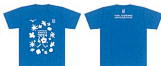
オリジナルTシャツ※画像はイメージです。 デザイン・配色は変更になる場合があります。