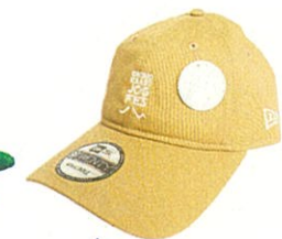
ニューエラ オリジナルキャップ