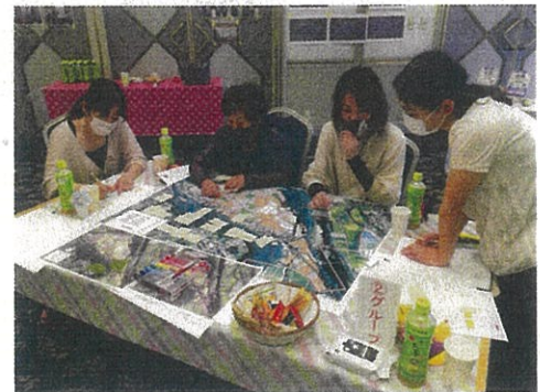
ファシリテーション研修の様子

女性候補者探しや推薦の依頼は、女性委員自らが行う。引退時には次の女性候補者を推薦し、立候補の手続きや引き継ぎ等のフォローも併せて実施することで、継続的な女性委員の登用を実現している。