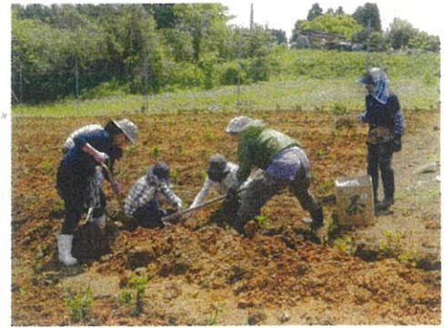
お茶の試験栽培の様子

会長の「男性も女性も活躍できる農業委員会を」という意向もあり、女性も様々なポジションを経験し農業委員会全体の意識向上を目指している。