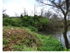
⑤内喜名港下り途中