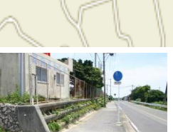
⑮城中までの下り坂