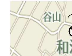
⑬あしきぶ公園貯水池