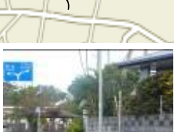
⑮新久保商店前T字路