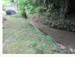
⑮内城小近く水源地