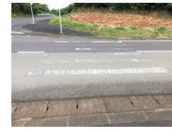
⑪学校からの道路と国道との交差点