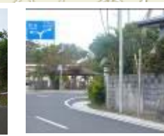
⑮あしきぶ公園貯水池