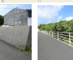
⑮あしきぶ公園貯水池