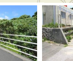
⑮あしきぶ公園貯水池