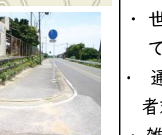
⑮あしきぶ公園貯水池