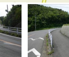
⑮あしきぶ公園貯水池