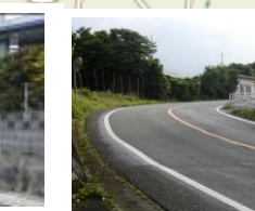
⑮あしきぶ公園貯水池