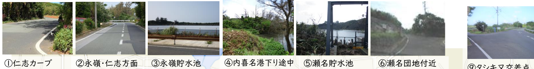
①仁志カーブ ②永嶺・仁志方面 ③永嶺貯水池 ④内喜名港下り途中 ⑤瀬名貯水池 ⑥瀬名団地付近