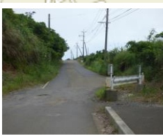
⑮あしきぶ公園貯水池