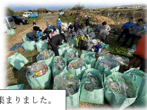
すごい量のごみが集まりました。