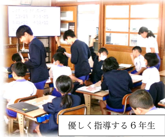
優しく指導する6年生

本校の特色ある教育活動の一つである和魂スタディタイムがありました。6年生が1〜5年生に勉強を教えるこの取組も、6年生にとっては最後となります。今回で3回目の取組とあって、それぞれのクラスで充実した学習が行われました。積極的に子供たちに関わっていく6年生がとても頼もしかったです。スタディタイムで得た学びをこれからの学習に役立ててほしいと思います。6年生の皆さん、お疲れさまでした。