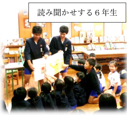
読み聞かせする6年生

そして、図書委員会の6年生にとっては、最後の読み聞かせとなりました。今回の読み聞かせもとても上手でした。聞いている子供たちも楽しそうに一生懸命に聞いていて素敵でした。進級しても、卒業しても、これからもたくさん本に親しんでほしいと思います。