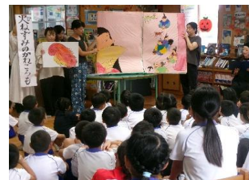
【あしばーや 読み聞かせ】