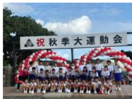
【運動会のバルーンゲート】