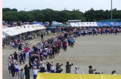
全校踊り「えらぶ百合の花」