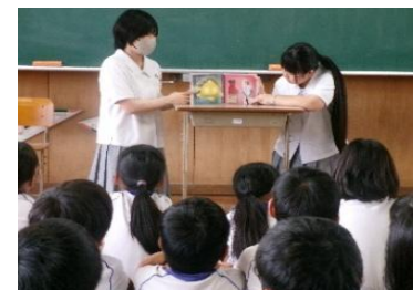
【沖高生 読み聞かせ】