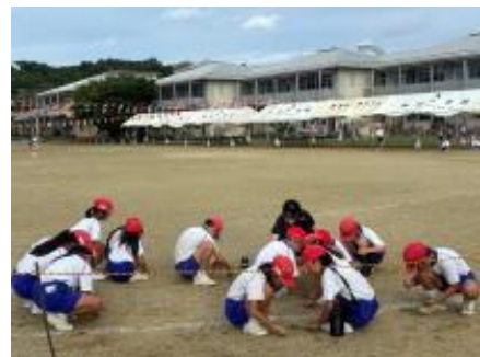
【うずしおタイムの草取り】

学校からの4つのお願い ~各御家庭での取組をお願いします。~ 「あいさつ、家庭学習、歩育(歩いて登校)、早寝・早起き・朝ご飯」