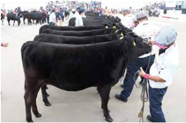
団体戦は姿形が揃っている点も評価される