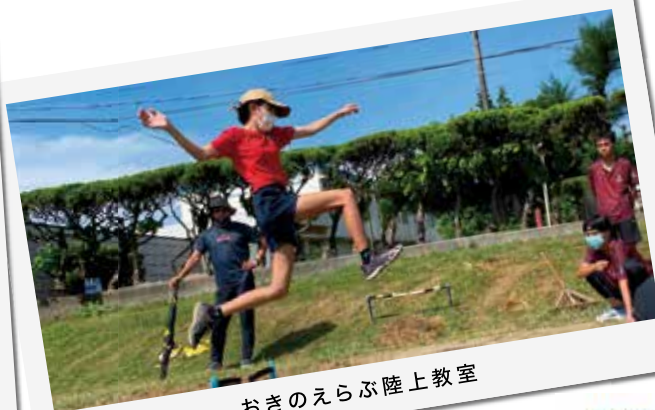
おきのえらぶ陸上教室

12月4日(日)にクリスマスバドミントン大会を計画しています。 詳細はサンサンテレビ文字放送又はクラブSNSよりご確認ください。