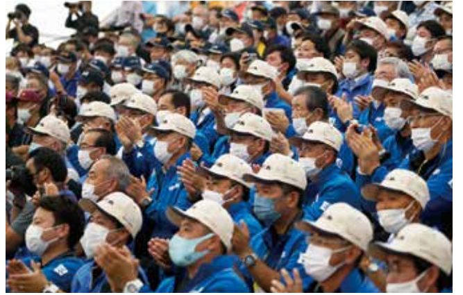
青色ジャケットのチーム鹿児島。審査の様子を見守る