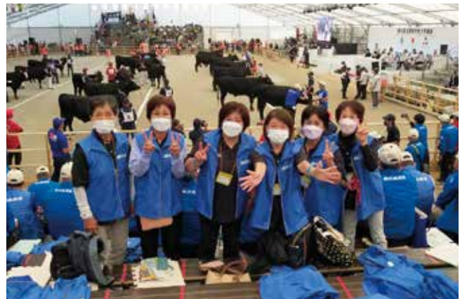
和泊町和牛振興会畜産女性部会員の方々！