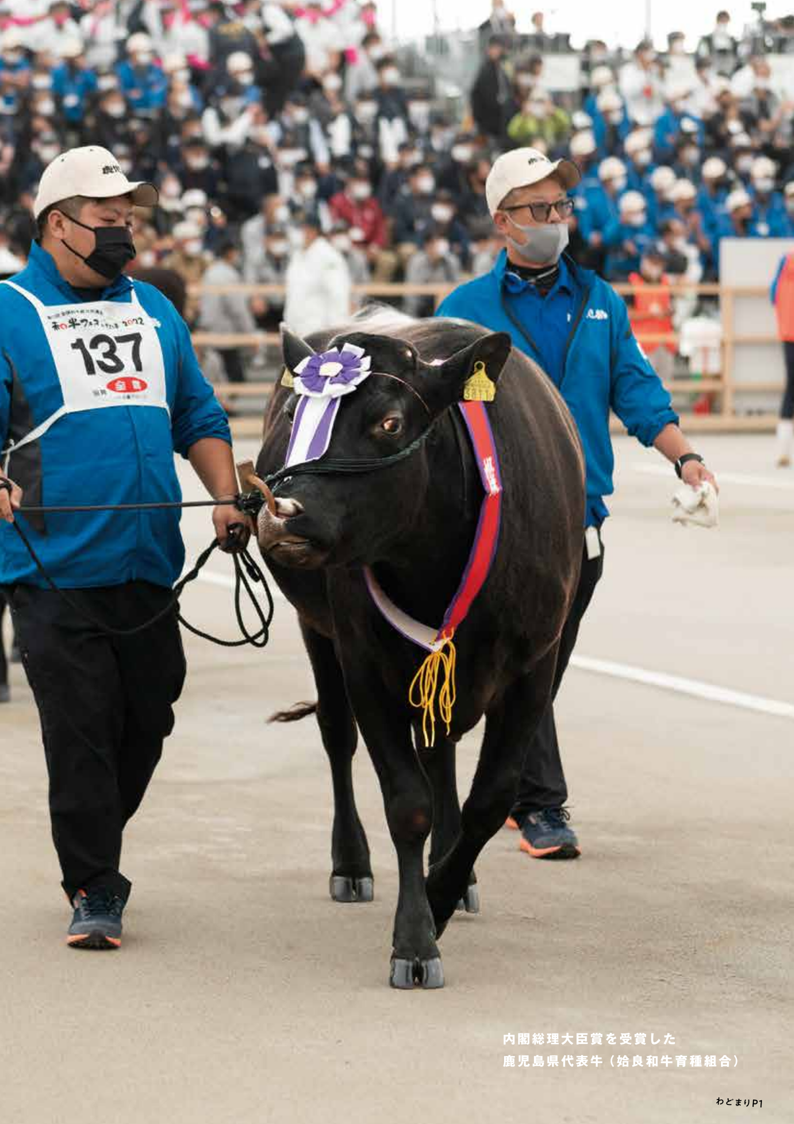
内閣総理大臣賞を受賞した 鹿児島県代表牛（始良和牛育種組合）