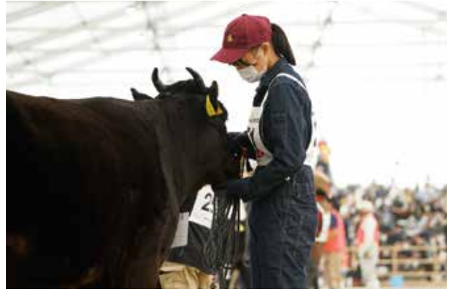
学生が出場する特別区では、女性の姿も多くみられた

「和牛」とは、日本固有の食肉専用牛のことで、黒毛和種・褐毛和種（あかうし）・日本短角種・無角和種の4品種しか「和牛」として認められません。国内で飼育されている和牛の90%以上は黒毛和種で、その中には鹿児島黒牛のほか、有名銘柄牛である神戸牛・松阪牛・近江牛などが含まれます。一方で「国産牛」とは、和牛以外の国産牛肉のことを指し、外国種や輸入牛も、国内で3ヶ月以上肥育すれば「国産牛」となります。さらには、国内の屠畜場で牛肉として処理加工されれば、輸入牛であっても全て「国産牛」となります。市場では「和牛」に対して「国産牛」が格下と序列されています。沖永良部島で飼育されているのは黒毛和牛で、粗飼料（草）を主体に牛に与えているため、本土の子牛より腹づくりがよく、病気になりにくい牛が育つのが特徴です。肉用牛の畜産農家は、繁殖農家と肥育農家とに別れていて、沖永良部島では繁殖農家を主とした農業形態となっています。繁殖雌牛が産んだ子牛は約8～9ヶ月育てられたのち、セリに出荷され、肥育農家のもとへ旅立っていきます。そして肥育農家で約20ヶ月肥育され食肉となり、私たちの胃袋を満たしてくれます。今回「和牛日本一」に輝いた鹿児島黒牛は、先人達が長い歳月をかけ、改良に改良を重ねて生まれたブランド牛です。現在では黒毛和牛の国内飼養頭数の13.5%を占め、全国No.1の和牛生産県となった鹿児島県。その鹿児島黒牛となる子牛の供給元として、沖永良部島は活躍しています！