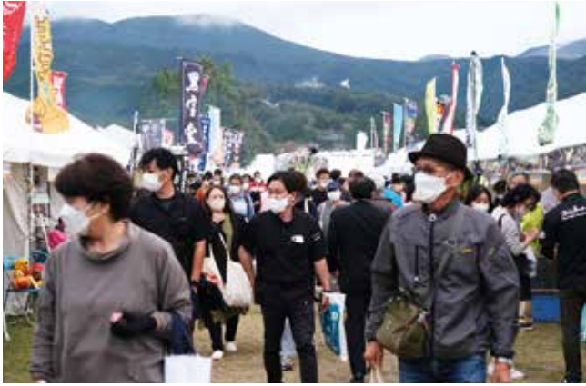
会場には多くの来場者が