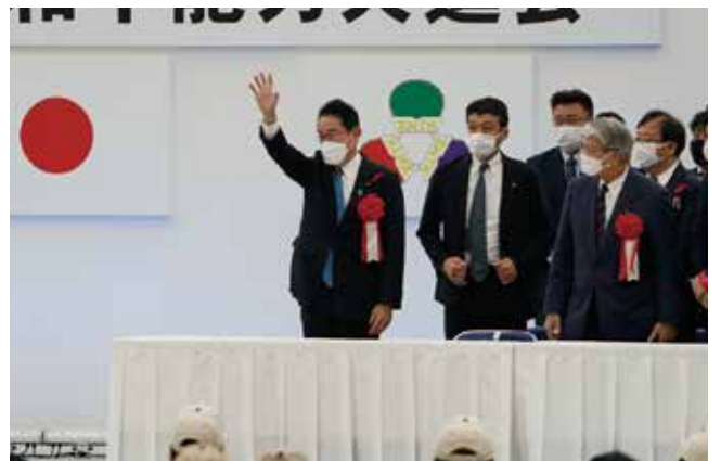
閉会式には岸田内閣総理大臣が出席