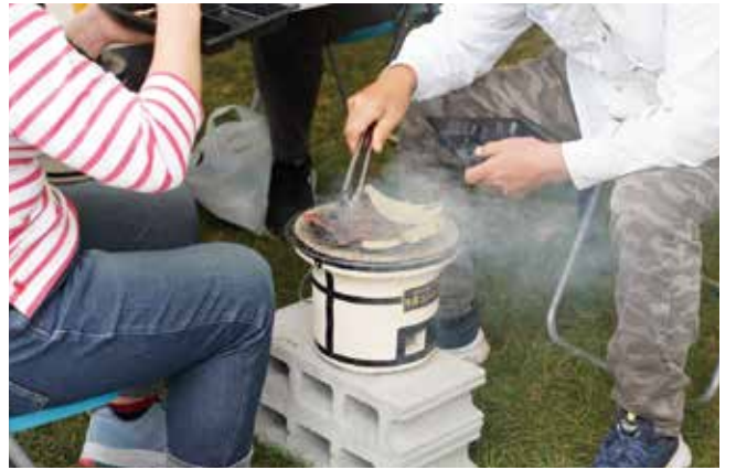
七輪で楽しむBBQコーナー