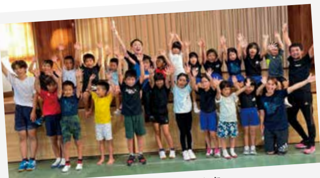
アクロバット体験教室

夏休み期間、クラブ主催イベントとして「小学生夏季集中講座」「アクロバット体験教室」、そしてEloveさん・沖永良部高校陸上競技部の皆さん・沖永良部中学校体育連盟の皆さんとの共同開催で「おきのえらぶ陸上教室」を開催しました。今後気温が下がっていきますので、準備運動やストレッチなどでしっかりと身体を温めた上で運動に取り組むことで怪我予防を行ってください。