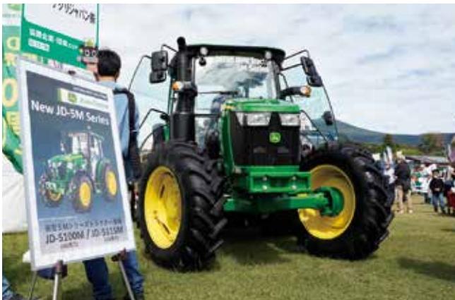
トラクターなどの農機具の展示も