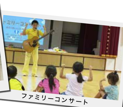
ファミリーコンサート