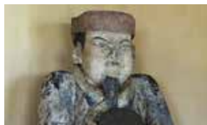
世之主神社に納められている世の主像

『皆さんは、進学などで島を離れた後、再び島に戻りますか。それとも島外で暮らしますか。私は、島に戻ろうと考えています。理由は、世之主の城跡があるからです。そう思うようになったのは、小学低学年の頃からよく城跡に行っていたからだと思えます。その頃城跡は、今の姿から想像できないほど木々に覆われ、人が気軽に訪れにくい所でした。しかし、それではいけないと有志の方々が伐採作業を行うことになり、作業に行く父と一緒に、私も時々行くようになりました。作業は難航しましたが少しずつ進み、城跡は本来の姿を取り戻していきました。城跡に行くとき、ロープを使って斜面を降りたり、身を隠すためと言われる石積みへのこみを見せてもらったりと様々な体験をし、私は行くのが楽しみになっていきました。さらに父は、「今日は月がきれいだから」「ちょっと気晴らしに」など小さなきっかけでも私を連れ出し、そのたびに思いが増え、城跡は私にとって大切な場所になっていきました。また、夜遅くまでライトをつけ伐採作業をする人、見晴らしの良くなった境内で語り合う人々などを見るうちに、世の主を想う人は私が考えていたよりも多く、世の主への想いが受け継がれていることを感じました。 私の今の将来の目標は、地域の人々が大切にしてきたこの城跡をこれからも守り、人が集う場所にして、次の世代へ引き継ぐことです。そのためにも、まだ知らない事の多い世の主や当時の歴史などを学び…(以下略)』 これからも、史跡や文化が、未来へはばたく子ども達の“島へのアイデンティティ”醸成の一助となりますように。