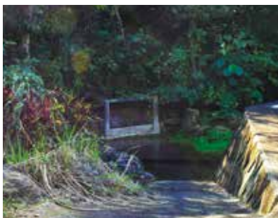
現在の「ティーガナシ」

西原字の西側にある湧水地「ティーガナシ」は、自然環境保護区の指定を受け、守るべき場所となっています。その昔私たちの先祖は、飲み水のある場所を探して住みつき、そこに集落を作ったとされています。和泊町では水不足が深刻な問題で、人口の増加とともに水の需要は増大し、西原字も同様に、水の供給場所である湧水や井戸がある場所に集落ができるようになりました。「ティーガナシ」は、水質・水量ともに良好で、やはり周辺には集落ができ、西原字民だけでなく、出花字東部の人たちにとっても生活に欠かせない場所で、昭和30年頃には、漁師や農家の方々が汚れを落とす水浴び場としても利用されていたようです。当時、水汲みや水運びは婦人の仕事で、水を入れた桶やバケツを頭に乗せ、石ころ道を何度も往復しなければならない重労働でした。水質がよく自然豊かな「ティーガナシ」は、魚やエビなどが生息する、子ども達にとって格好の遊び場であり、また、夜になるとホテルが光りを発する幻想的な場所でもありました。時代は変わり、現在の「ティーガナシ」は昔のように水の供給場所や子ども達の遊び場としての賑わいはなくなりましたが、先人が残した重要な場所、「ティーガナシ」は地域全体で守り、受け継がれていくことでしょう。