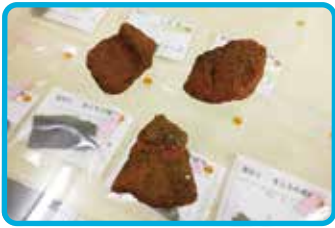
城当遺跡出土の兼久式土器

“城当遺跡”発見の瞬間です。出土した土器は、写真のように底の部分が「くびれ平底」形をし、その平らな底面には「葉っぱの葉脈の痕」、胴部の外面には器面を一周する文様帯が張り付けられています。これらは“兼久(カネク)式土器”と呼ばれる土器の特徴で、6～11世紀頃(日本本土では古墳後期/飛鳥/奈良/平安時代)に奄美群島一帯で流行したことが分かっています。