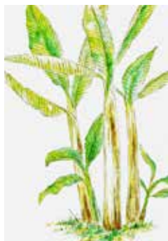
バナナにそっくり!「イトバショウ」 イラスト：竹松 孝太郎

この島では、芭蕉布を作る技術はいったん途絶えましたが、現在、復活した伝統技法を知名町下城の芭蕉布工房で見ることができ、また、和泊町歴史民俗資料館では、実際に使用されていたバシヤチバラが展示されています。これらに触れ、先人の知恵と努力に思いをはせてみてはいかがでしょうか。