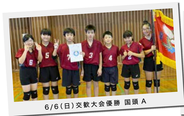
6/6(日)交歓大会優勝 国頭 A

巡回体操教室・わらんちゃ体育教室・スーパーキッズでは運動大好き子を育てる活動を行っています。技術的な指導も大事ですが、遊びを通して多様な動きを経験することを目的とした活動を展開しています。FacebookページやYouTubeにて、縄跳び・マット・跳び箱活動の様子を載せていますので是非ご覧下さい。