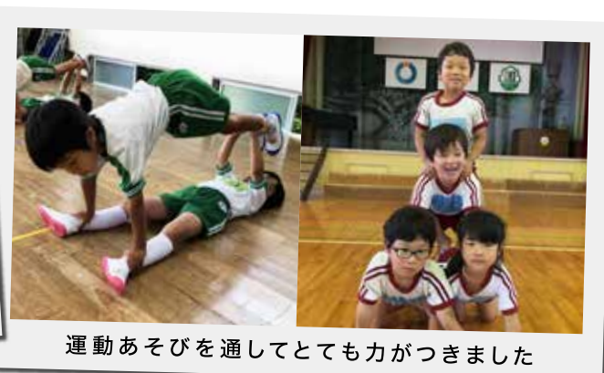
運動あそびを通してとても力がつきました

ダンスやサッカーといった子ども向けの運動教室、高齢者向けの健康ヨガ教室をはじめ、バレー・ミニバレー・バドミントン・太極拳などの各種サークル活動も実施しております。日頃の運動機会に参加されてみてはいかがでしょうか?