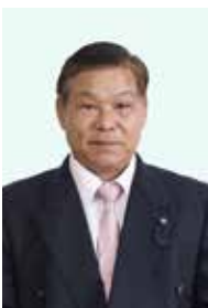
副議長 / 桂 弘一