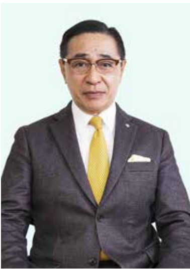
町長 / 前 登志朗

行政としては、最新テクノロジー活用も視野に地域課題を解決し、心豊かに暮らせる社会の実現に向けた取り組みなどについて検討を行い、まちづくりを総合的かつ計画的に進めるため、効率的な町民サービスの提供や効率的な行政事務の推進を図ります。