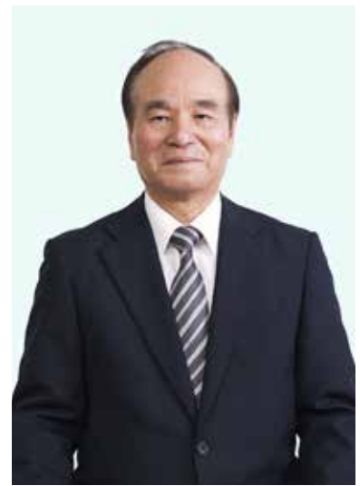
教育長 / 竹下 安秀