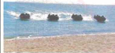
偵察用ボートによる着上陸