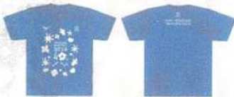
オリジナルTシャツ※画像はイメージです。 デザイン・配色は変更になる場合があります。