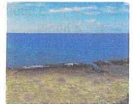
オーシャンビューエリア