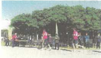
5 kmコース日本一のガジュマル