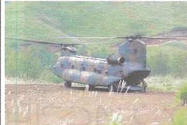
ヘリコプターによる降着