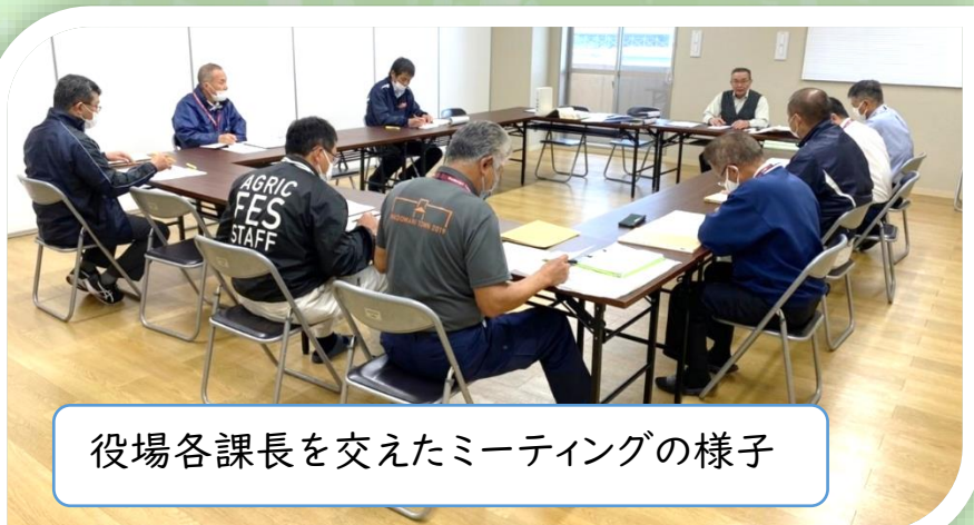
役場各課長を交えたミーティングの様子

町制施行以降の和泊町の来し方をまとめるのが行政編部会です。役場各課が全面協力し、町発展の歩みをさかのぼる作業が続いています（左写真）。