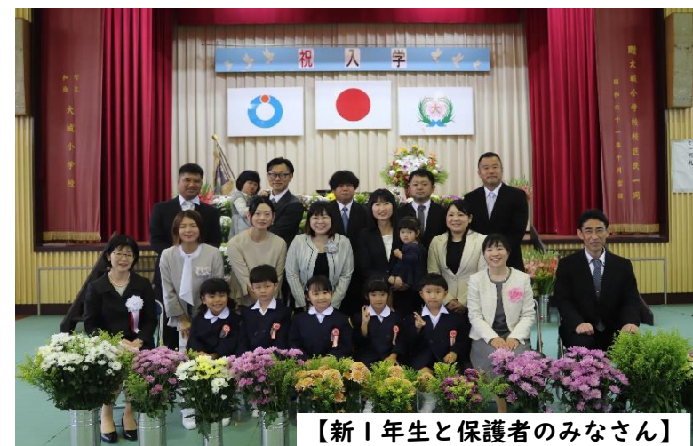
【新1年生と保護者のみなさん】